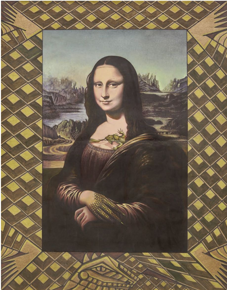
M.B. Guanaconda con Leo Técnica mixta sobre papel 53 x 68 cm 1989