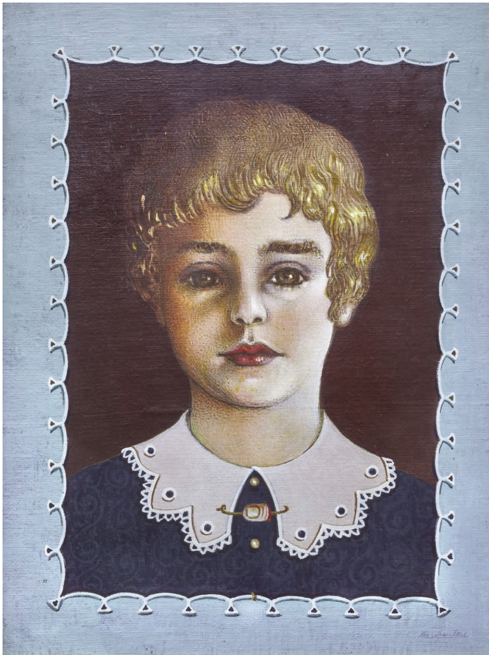
M.B. El hijo del torturador Técnica mixta sobre lienzo 24 x 32 cm 1974