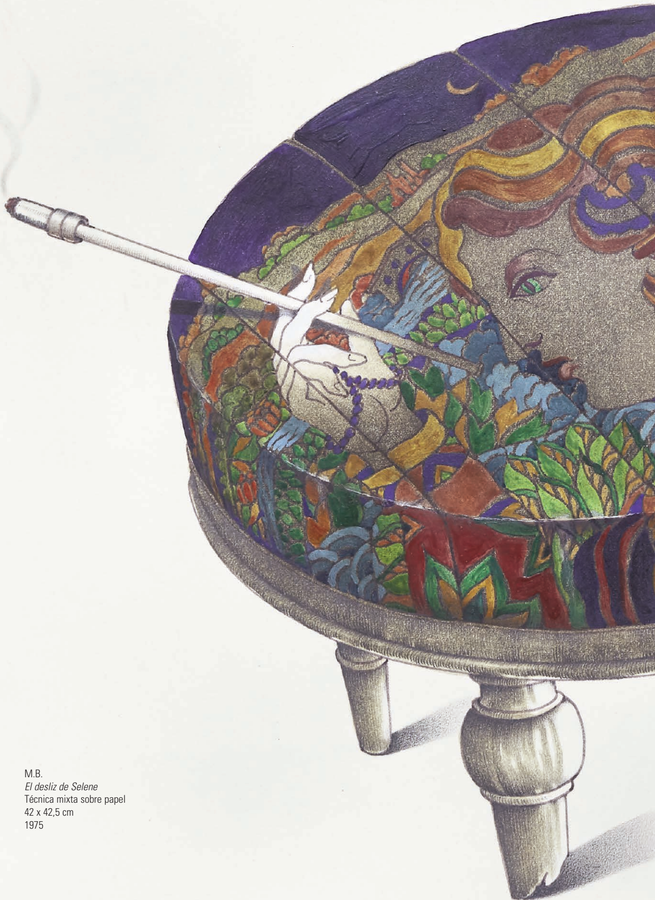
M.B. El desliz de Selene Técnica mixta sobre papel 42 x 42,5 cm 1975