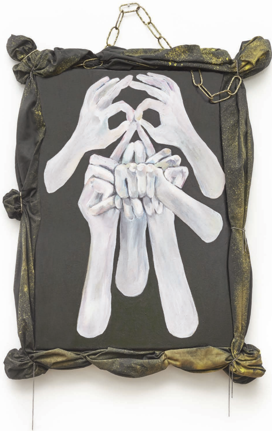
L.C. Sin título #6 Técnica mixta sobre tela 63 x 89 cm 2015