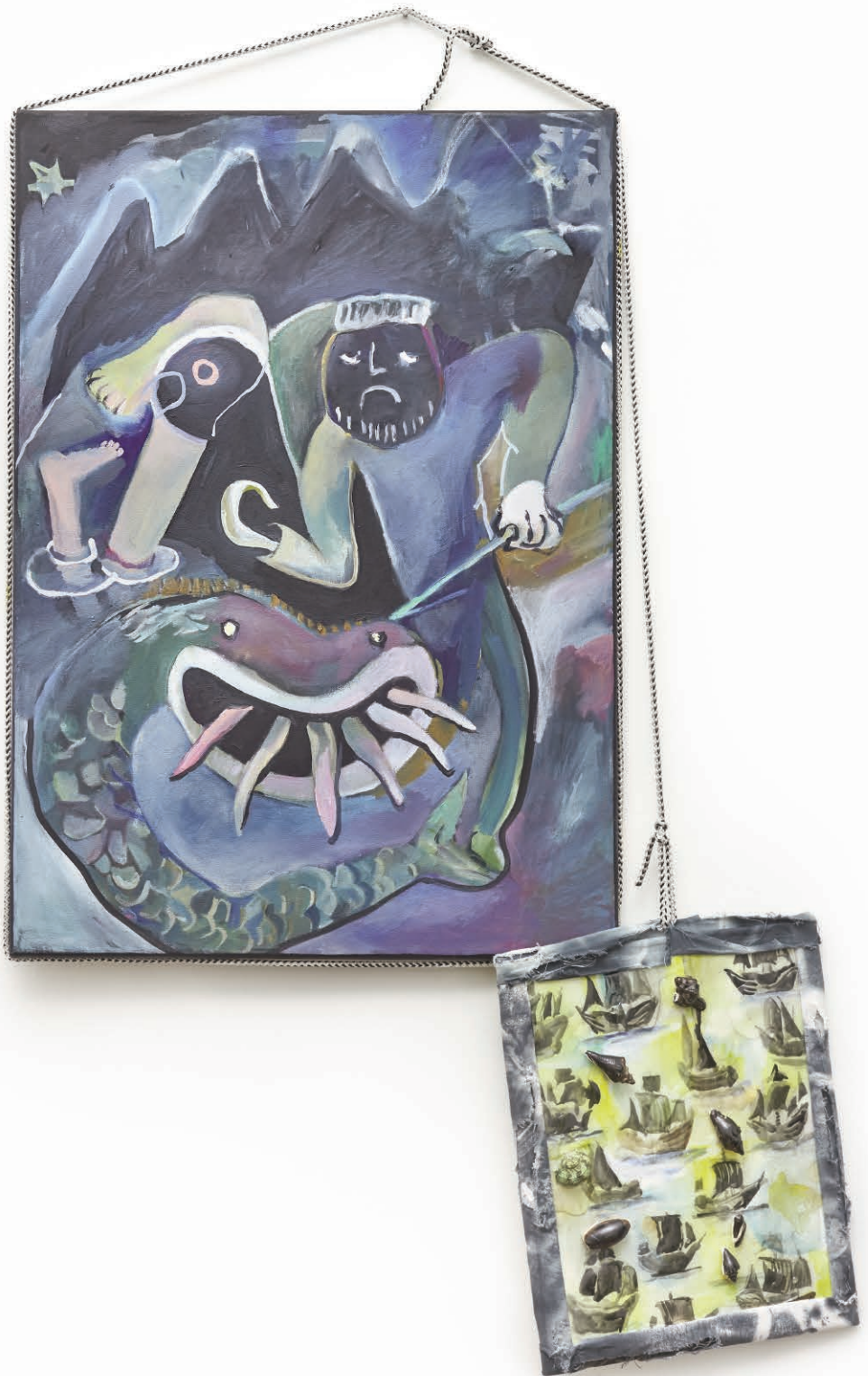
L.C. Sin título #4 Técnica mixta sobre tela. 69 x 104 cm 2015