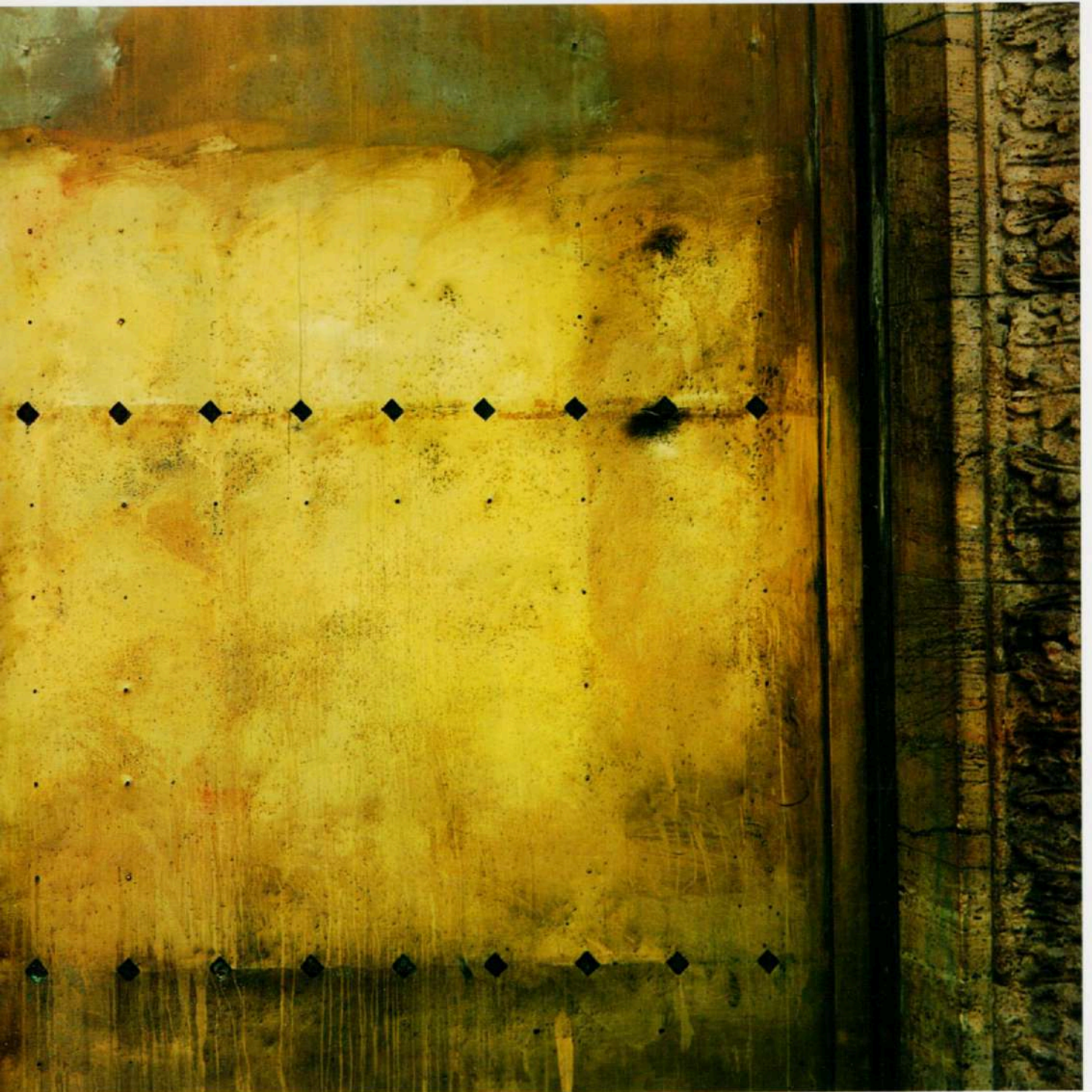
HSBC. Buenos Aires, 2005 - Copia-c - 120 x 60 cm