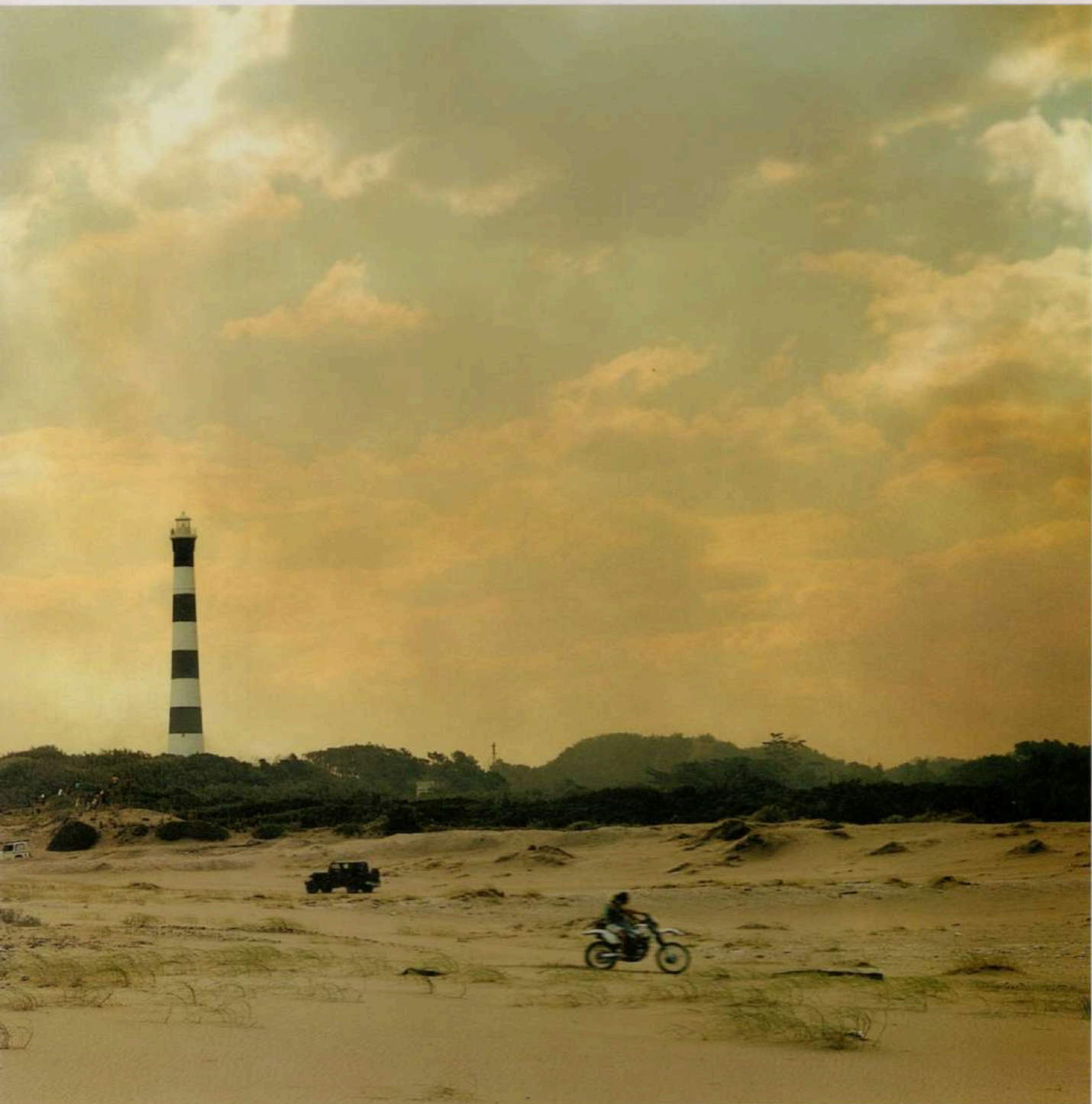
PRIMER PREMIO FUNDACIÓN FEDERICO J. KLEMM 2004 Claromecó, 2004 #3 - Copia-c - 120 x 60 cm