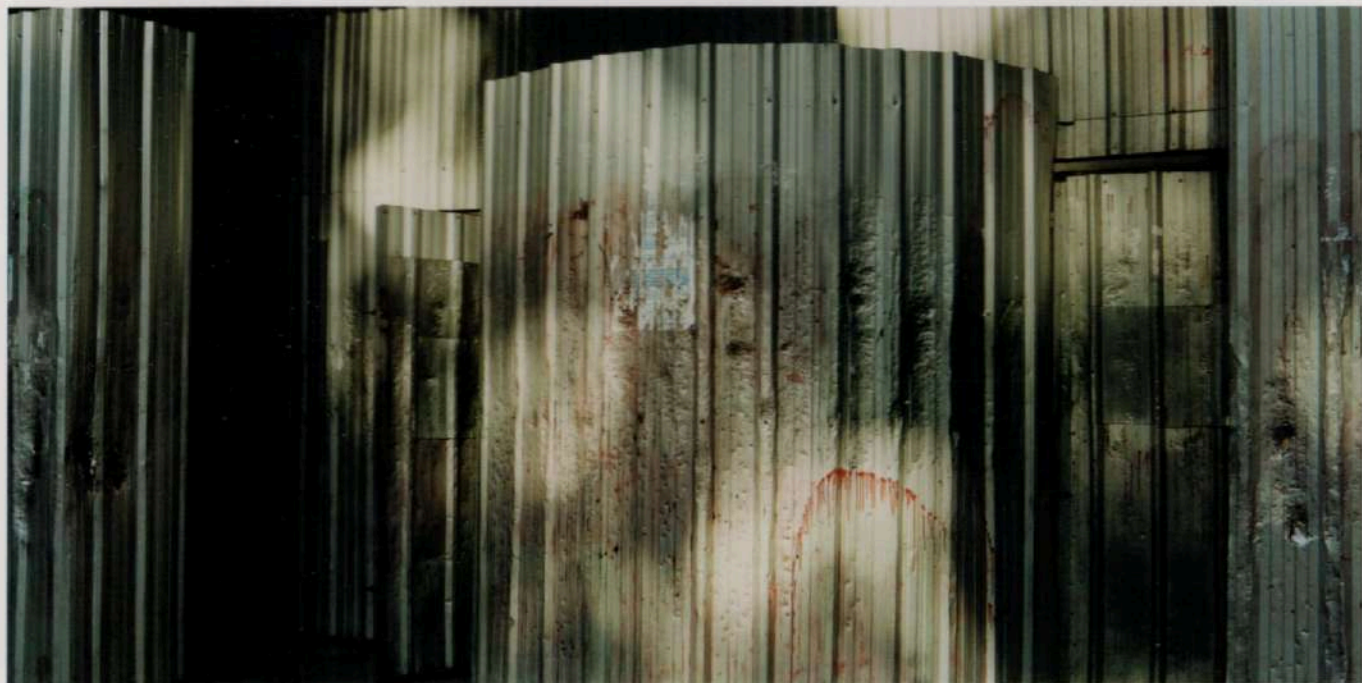
Lloyds Bank. Buenos Aires, 2003 - Copia-c - 120 x 60 cm