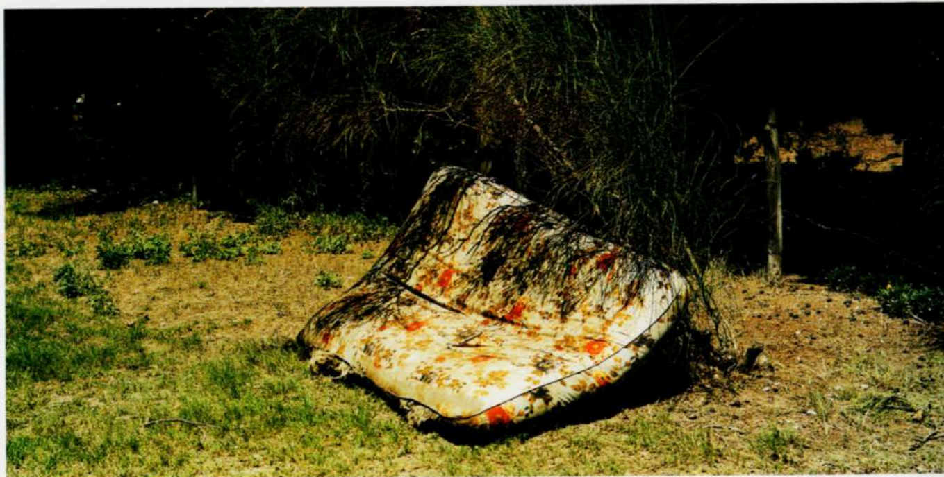
Claromecó, 2005 #3 - Cópia-c - 120 x 60 cm