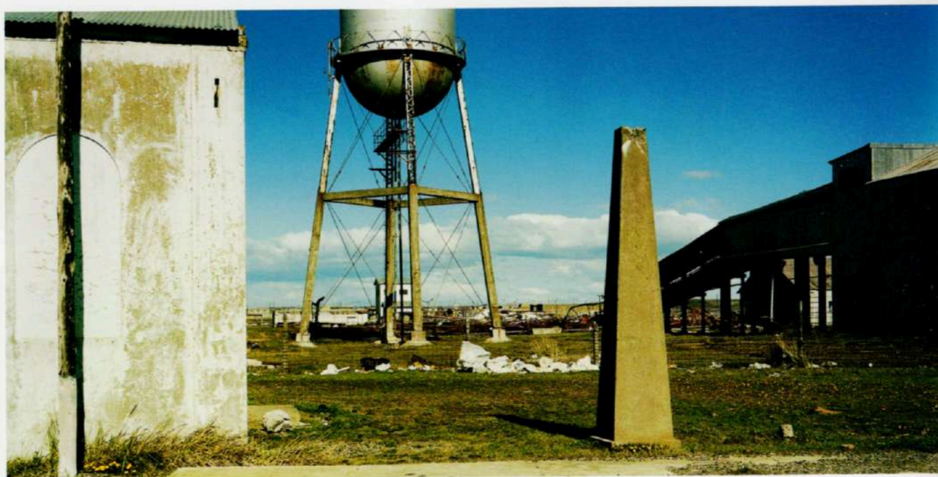
Rio Grande, Tierra del Fuego, 2004 #2 - Cópia-c - 120 x 60 cm