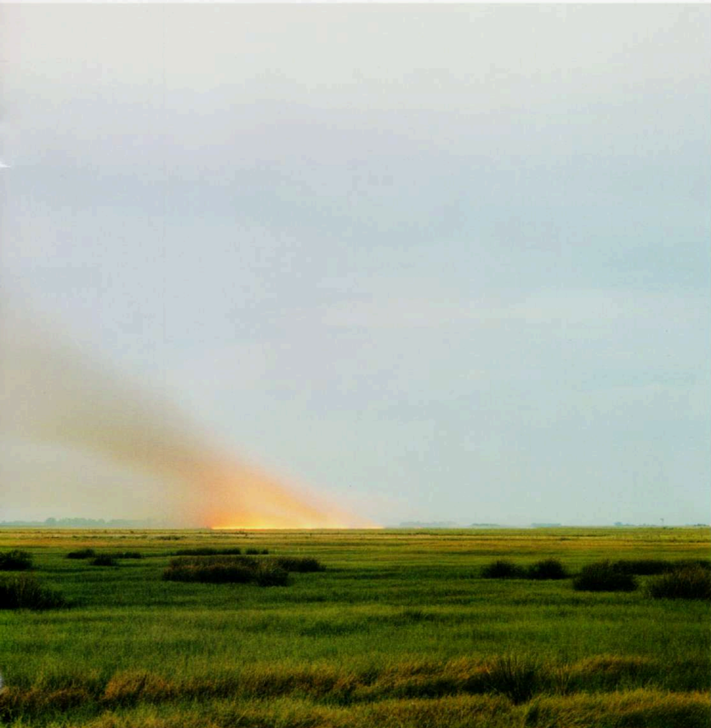
Claromecó, 2005 #2 - Copia-c - 120 x 60 cm