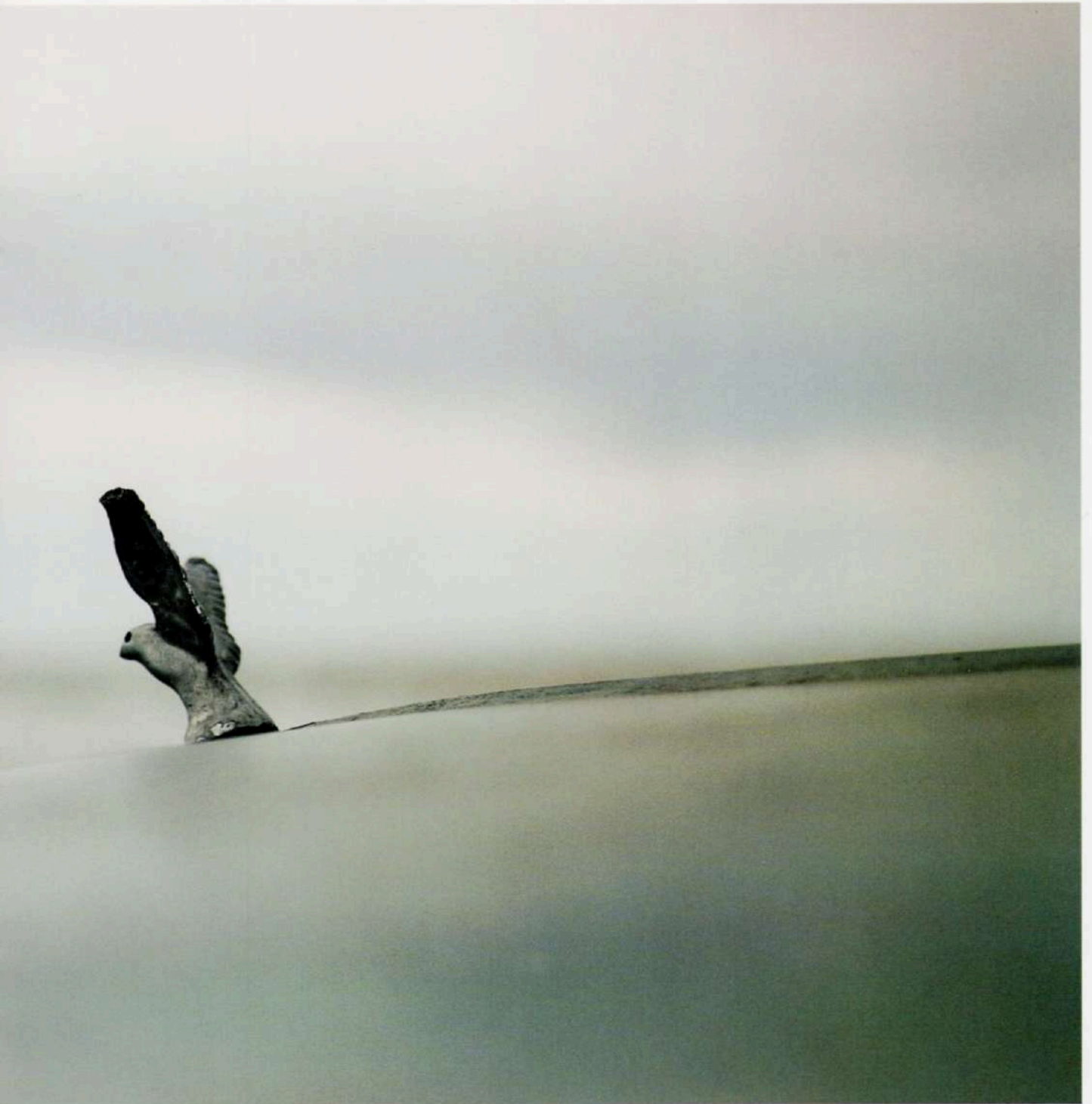
Capó de Rastrojero. Punta Lara, 2004 - Copia-c - 120 x 60 cm