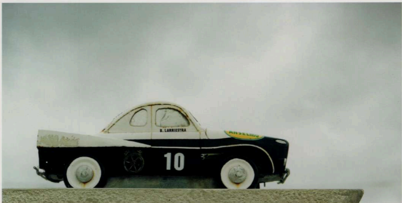
Monumento. Tres Arroyos, 2005 - Copia-c - 120 x 60 cm