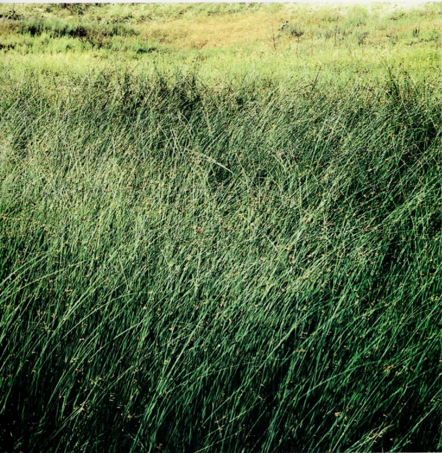
Claromecó, 2005 #6 - Copia-c - 120 x 60 cm