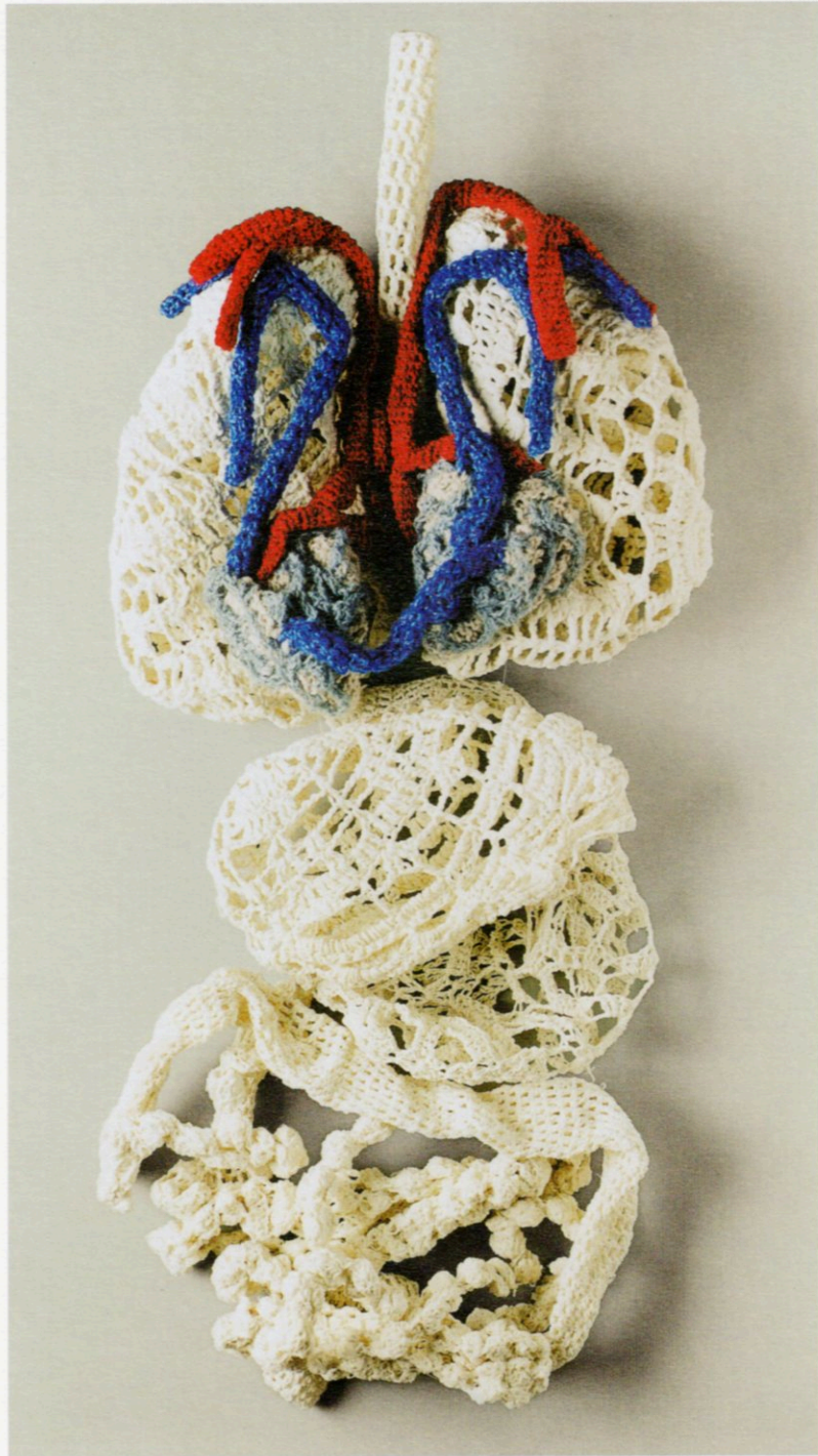
Donaciones - doble corazón; tejido en hilo, lana y yeso, 2002.