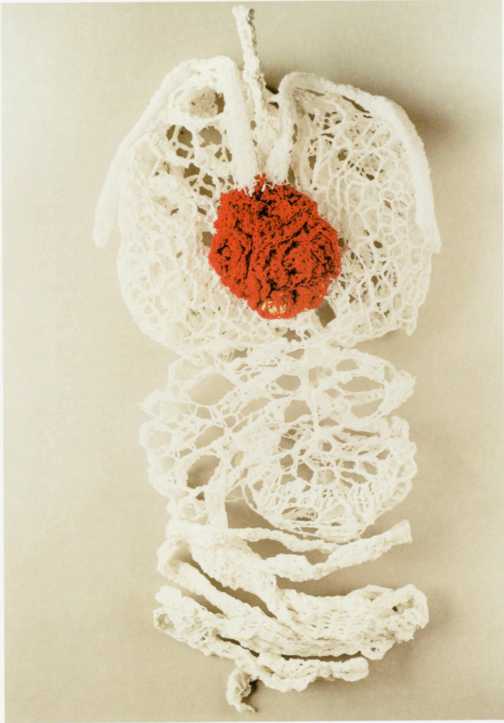
Donaciones - corazón; tejido en hilo, lana y yeso, 2003.