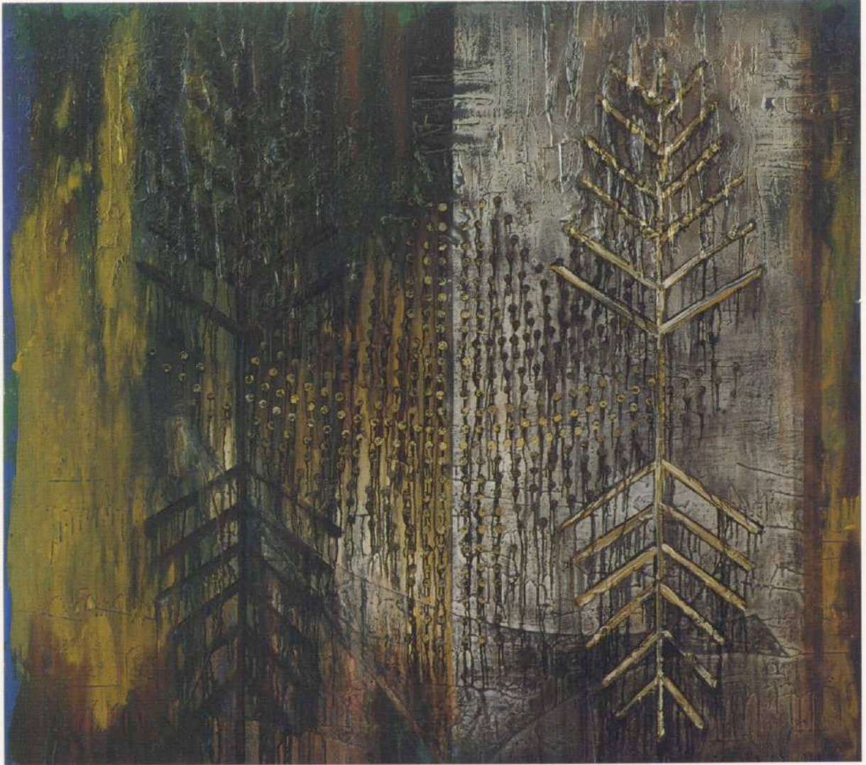
De Tiempos Sagrados - Ofrenda. Oleo sobre tela. 152 x 167 cm. Nueva York, 1993.