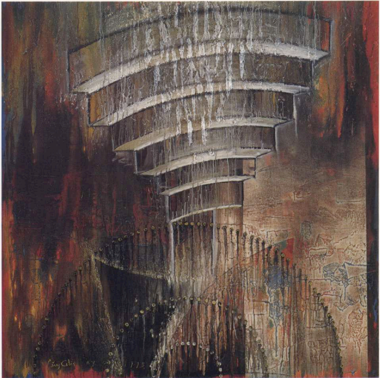
Ritual Iniciación. Oleo sobre tela. 167 x 167 cm. Nueva York, 1993.