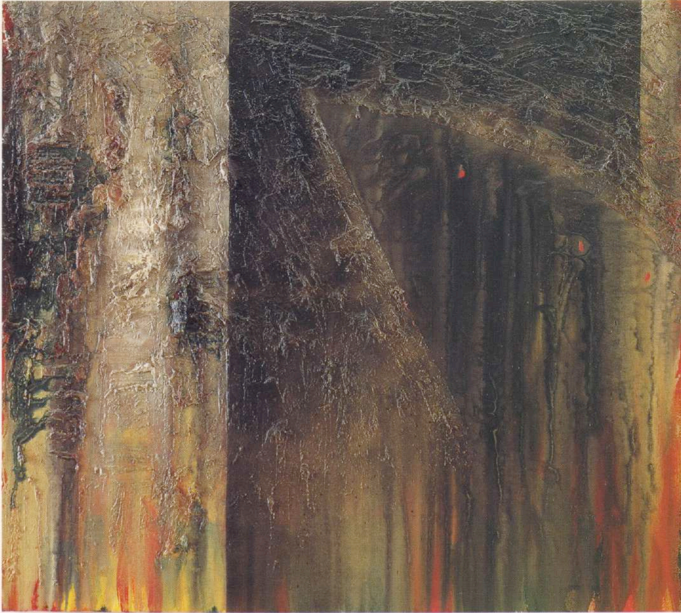
Presencia Maya - Mariposa. Oleo sobre tela, Díptico. 122 x 274 cm. Nueva York, 1993.