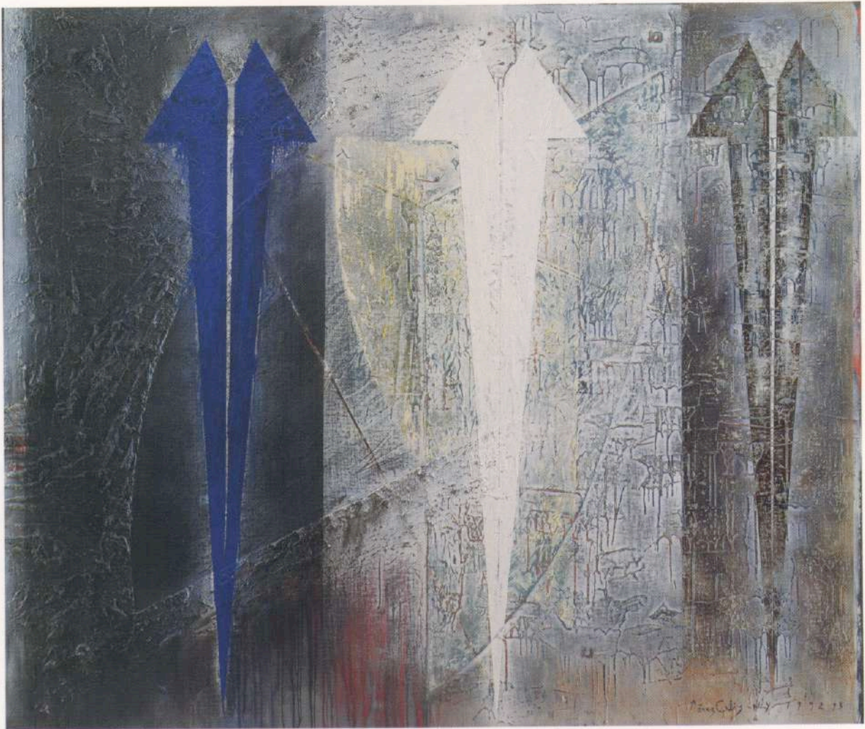
En el Fondo de la Memoria. Oleo sobre tela. 163 x 193 cm. Nueva York, 1993.