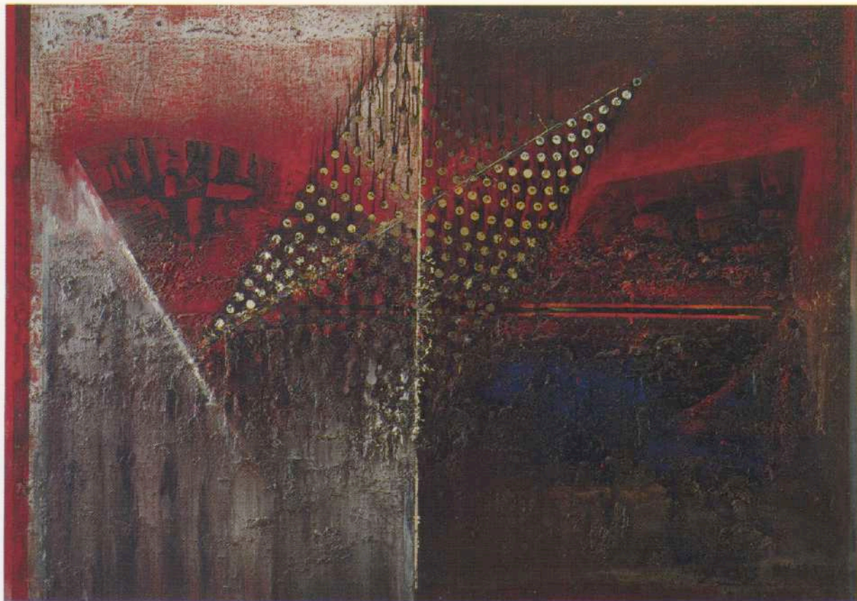
Travesía - (El naufragio). Oleo sobre tela. 117 x 163 cm. Nueva York, 1993.