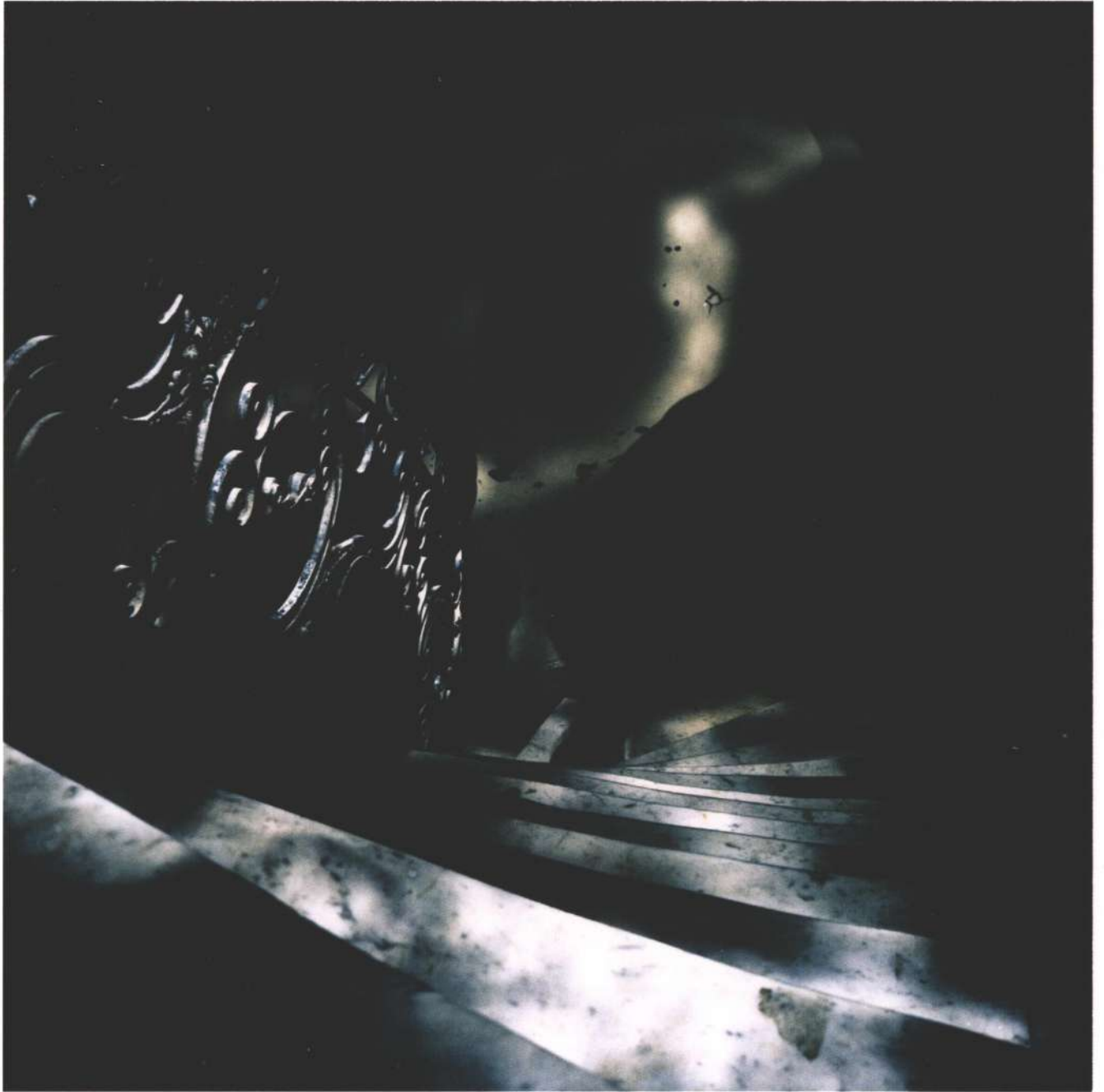
Arturo Aguiar, El descenso , 2005 Fotografía color, toma directa de acción, 100 x 100 cm.