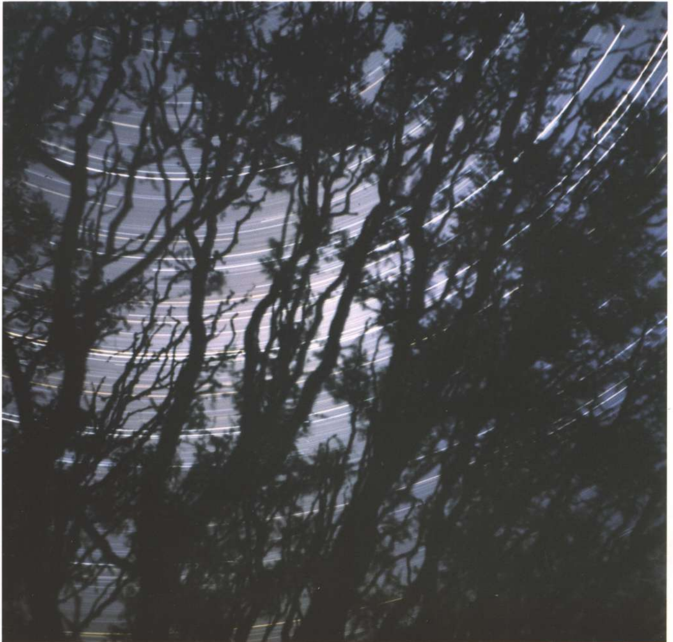
Pablo Zicarello, serie Estado de tiempo : Árbol #2 , 2003/2008 Fotografía color, 40,5 x 40,5 cm.