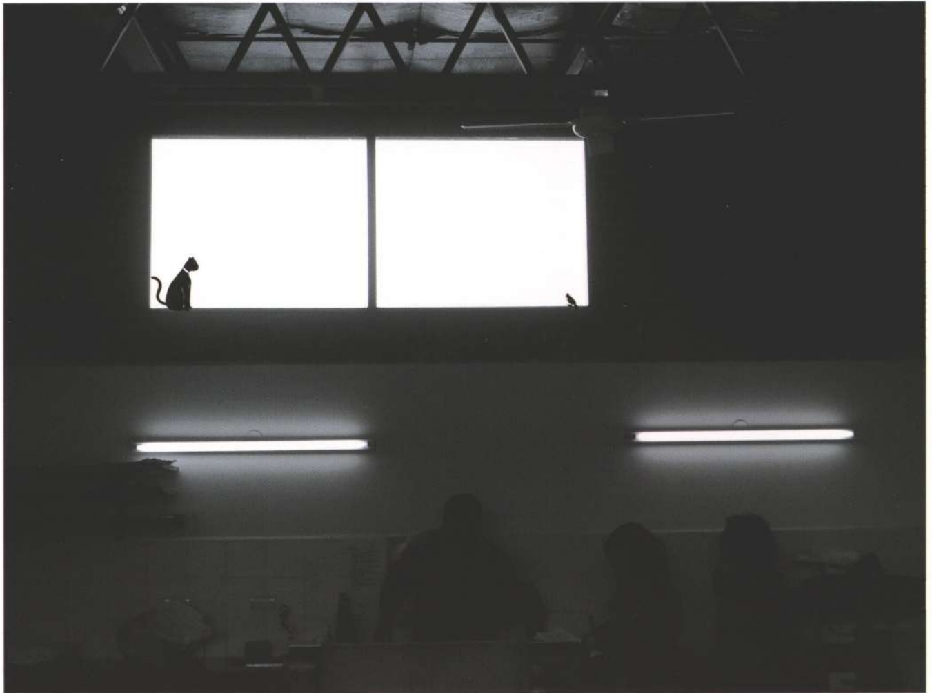
Andrea Ostera, Incidente N. 3 , 2007 Fotografía blanco y negro, 26 x 35 cm.